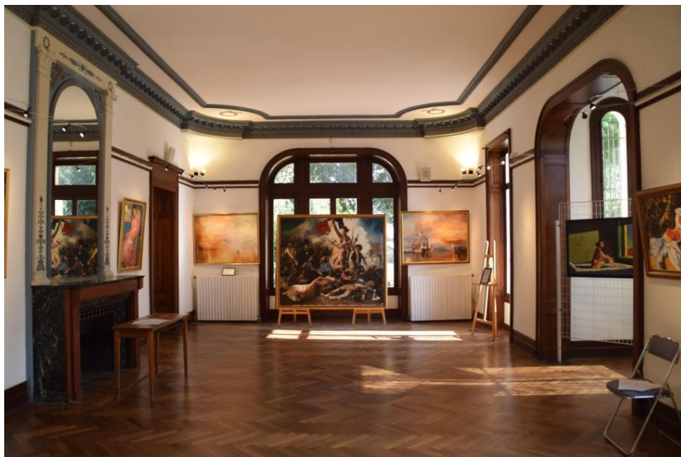
Salle 1 (Sarah Bernhardt), Maison Louis David