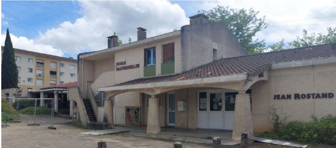
Site de la future école :