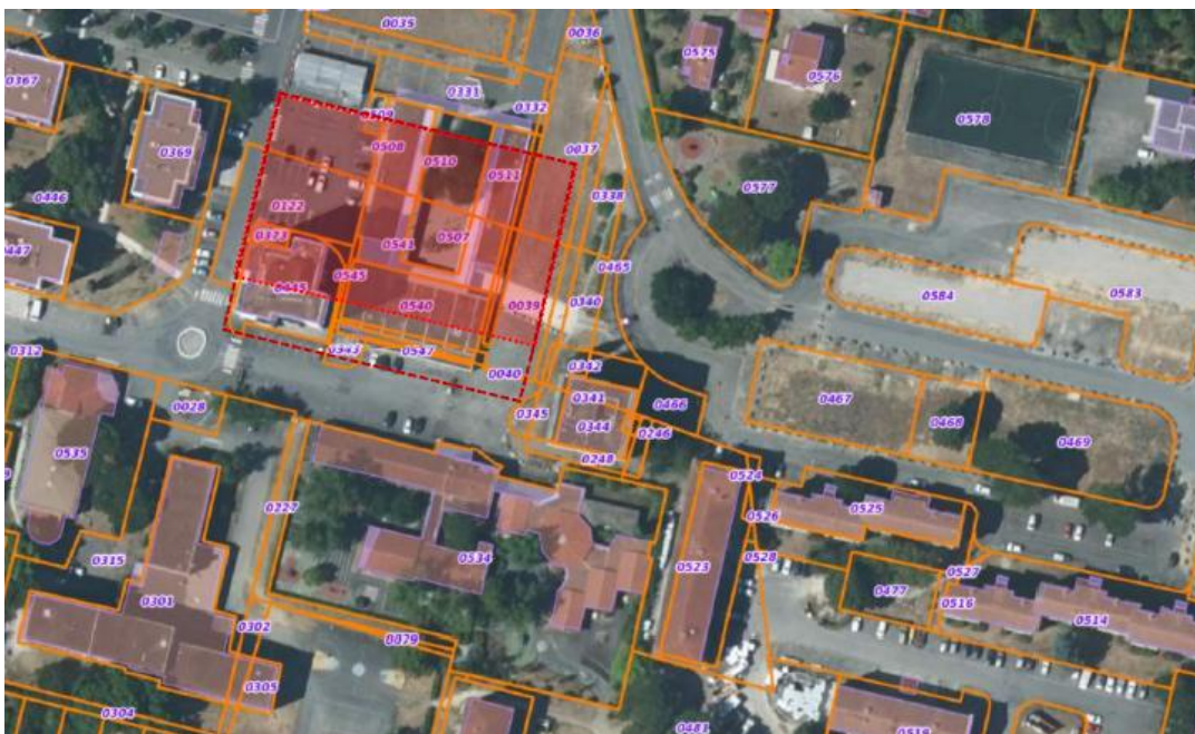
Plan de masse :